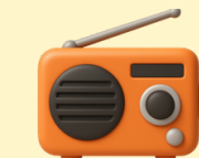
Radio, téléphone, piles