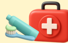
Trousse de secours et produits d'hygiène