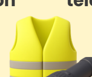
Lampe torche, sifflet et gilet de sécurité