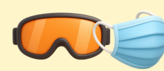
Masque et lunettes de protection